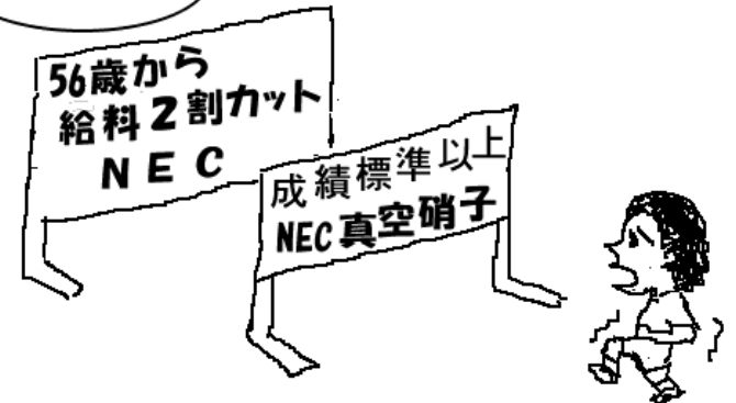
電機大手の雇用継続制度