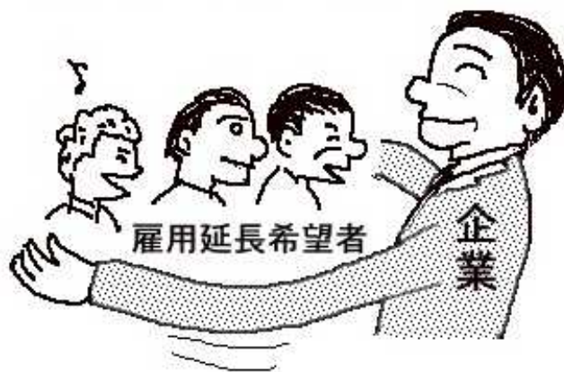
《 厚労省研究会の提言 》